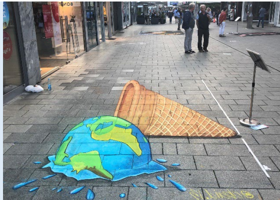
Informationen zum StreetArt-Festival unter www.streetart-swiss.ch