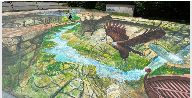
Das Highlight! 650 m2 grosses XXL-3D-Illusionsbild